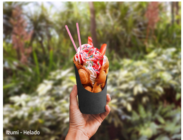
Izumí - Helado

Todo el sabor se acelera en tan solo unos días a bordo del Utopia of the Seas SM . Lleva tu paladar a una nueva gira mundial, una y otra vez, en más de 20 restaurantes exclusivos. Deslúmbtrate con los platos básicos del brunch de soul food, como el pollo frito y los waffles combinados con mimosas burbujeantes. Recargue energías entre los chapuzones de la tarde con deliciosos bocadillos a solo unos pasos de la piscina. Disfruta de la cena estilo japonés una noche, y la siguiente, disfruta de pizzas en horno de leña y platos rústicos italianos al aire libre. O conviértete en un trotamundos con noches temáticas internacionales en nuestro mejor y más complaciente buffet, que sirve más de 200 platos de cinco estrellas cada noche. Y todo está a bordo para una aventura culinaria en una experiencia gastronómica inmersiva que lleva los sentidos, y a ti, por todo el mundo. Prepárate para antojarte de fin de semana, como nunca antes.