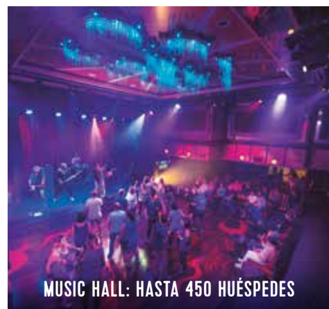
MUSIC HALL: HASTA 450 HUÉSPEDES