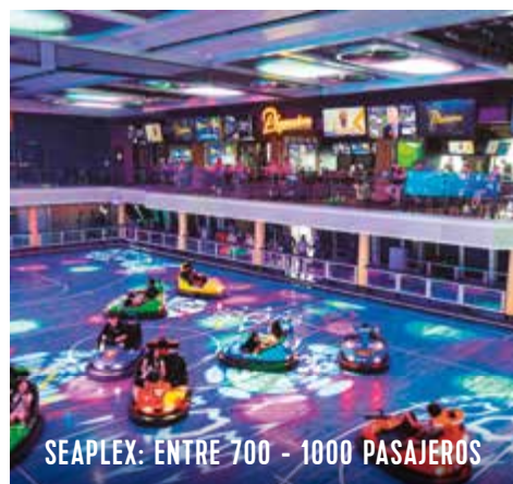
SEAPLEX: ENTRE 700 - 1000 PASAJEROS