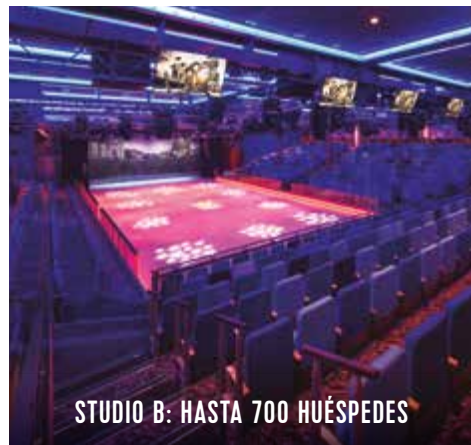
STUDIO B: HASTA 700 HUÉSPEDES