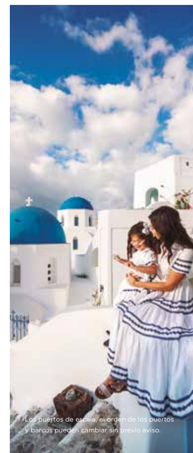
Los puertos de escala, el orden de los puertos y barcos pueden cambiar sin previo aviso.