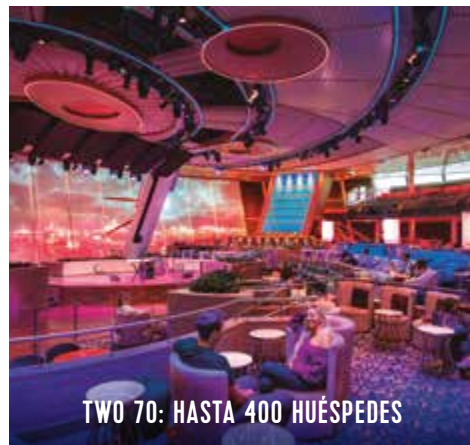
TWO 70: HASTA 400 HUÉSPEDES