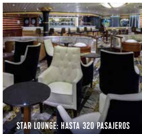
STAR LOUNGE: HASTA 320 PASAJEROS