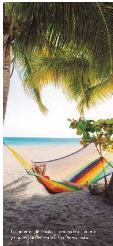
Los puertos de escala, el orden de los puertos y barcos pueden cambiar sin previo aviso.