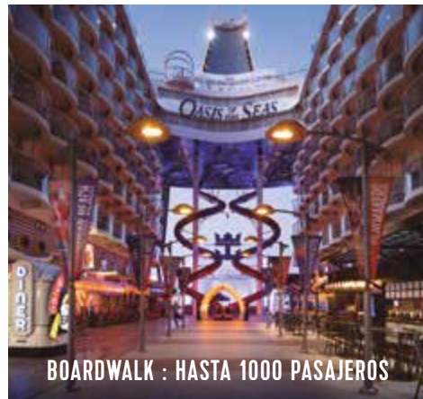
BOARDWALK : HASTA 1000 PASAJEROS