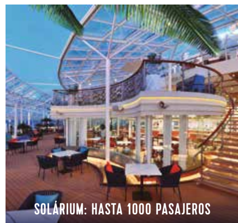
SOLÁRIUM: HASTA 1000 PASAJEROS