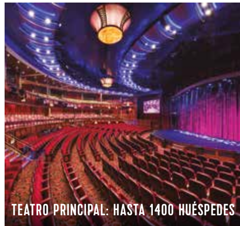
TEATRO PRINCIPAL: HASTA 1400 HUÉSPEDES