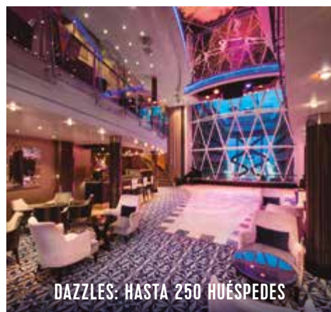
DAZZLES: HASTA 250 HUÉSPEDES