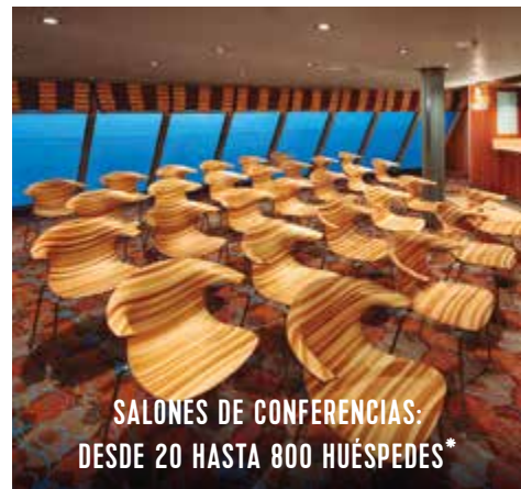
SALONES DE CONFERENCIAS: DESDE 20 HASTA 800 HUÉSPEDES*