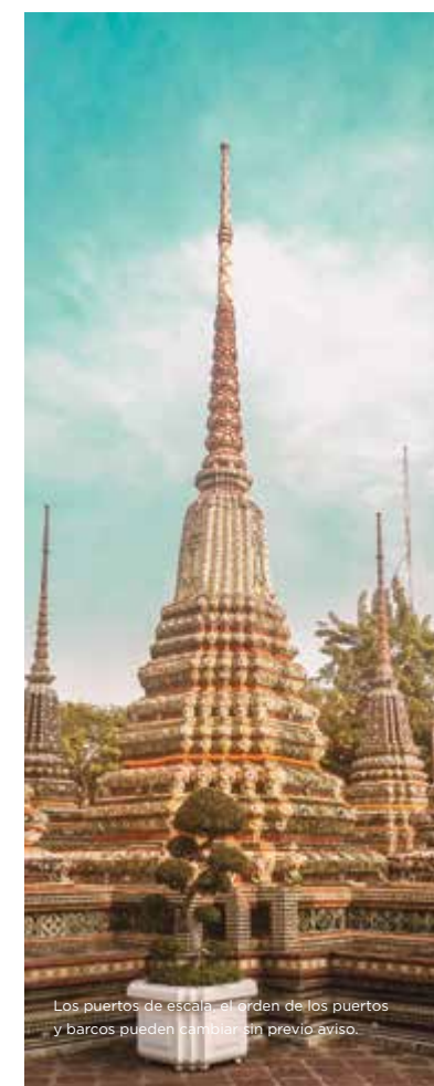
Los puertos de escala, el orden de los puertos y barcos pueden cambiar sin previo aviso.