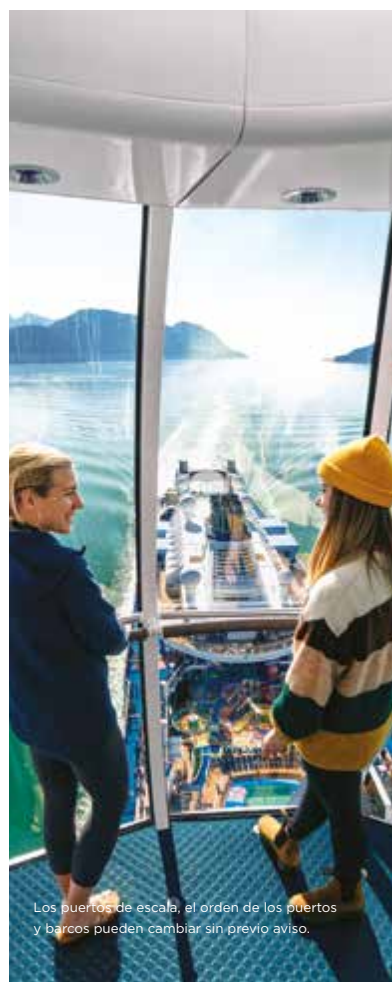
Los puertos de escala, el orden de los puertos y barcos pueden cambiar sin previo aviso.