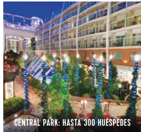
CENTRAL PARK: HASTA 300 HUÉSPEDES