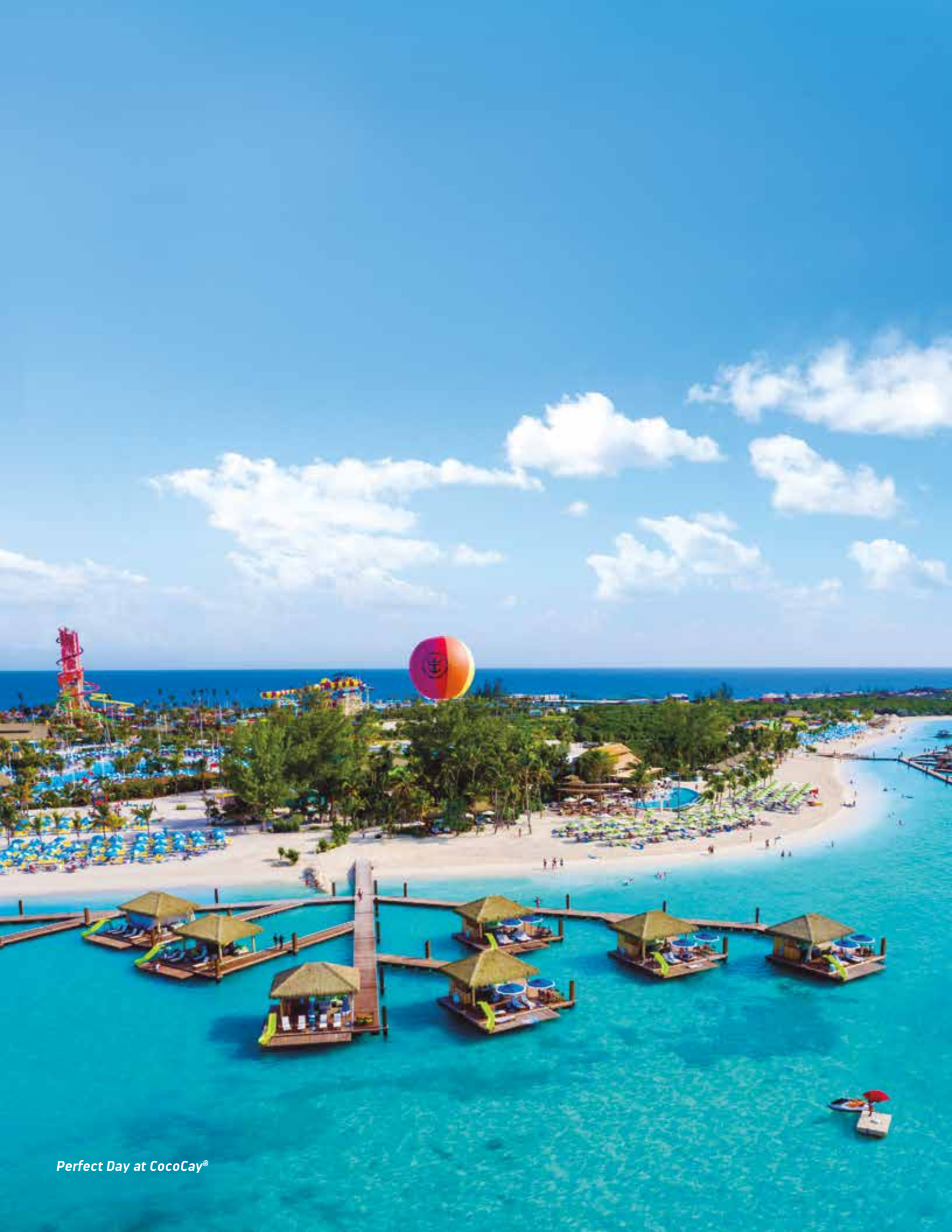
Perfect Day at CocoCay®