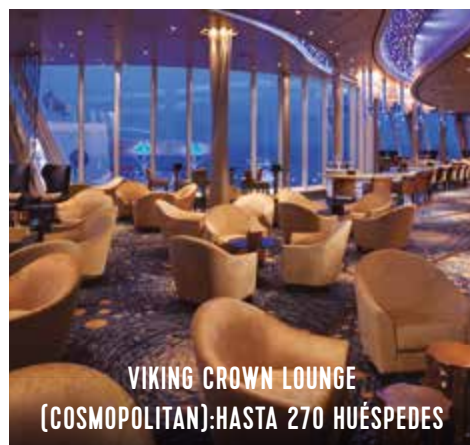
VIKING CROWN LOUNGE (COSMOPOLITAN):HASTA 270 HUÉSPEDES