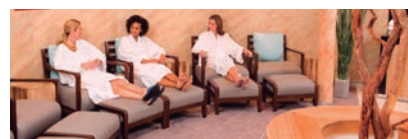
VITALITY AT SEA SPA AND FITNESS CENTER