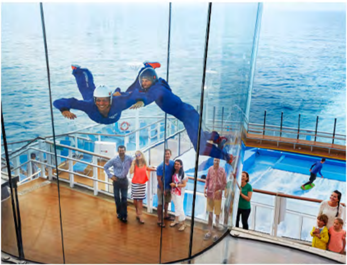
Rip-Cord by iFly®