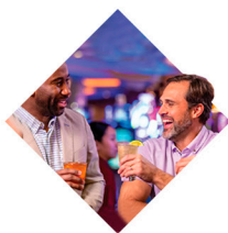
Cocktail de Bienvenida