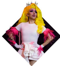
Drag Show y Bingo