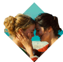
LGBT Movie Night

Y otras atracciones ofrecidas en el barco como shows de teatro estilo Broadway, espectáculos sobre agua y hielo, música en vivo y mucho más.